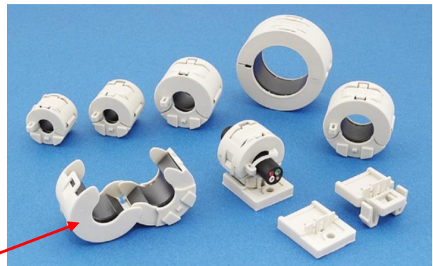
ワンタッチケース本体